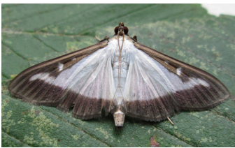
La pyrale du buis la plus commune