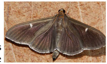
La pyrale du buis brune